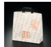
[73000] 手提げ紙袋 1枚 50円(本体価格46円)