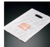
[73001] ナイロン袋 1枚 10円(本体価格9.1円)